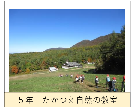
5年 たかつえ自然の教室

一気に到来した秋。指扇小学校でも「行事の秋」の真っ盛り。まずは、第2学年の遠足、続いて第6学年の修学旅行、そして第5学年のたかつえ自然の教室と、次々と続けました。行事や取組を通して経験することが、子どもたちにとって大切な思い出となり、笑顔が輝きます。