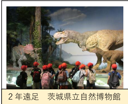
2年遠足 茨城県立自然博物館